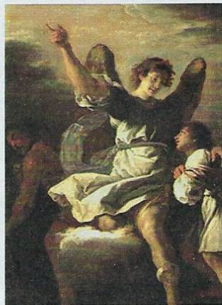
L'Angelo Custode protegge un bambino da un demone. Domenico Fetti (1615-1618). Museo del Louvre, Parigi.

XXVII sett. del Tempo Ordinario - III sett. del Salterio